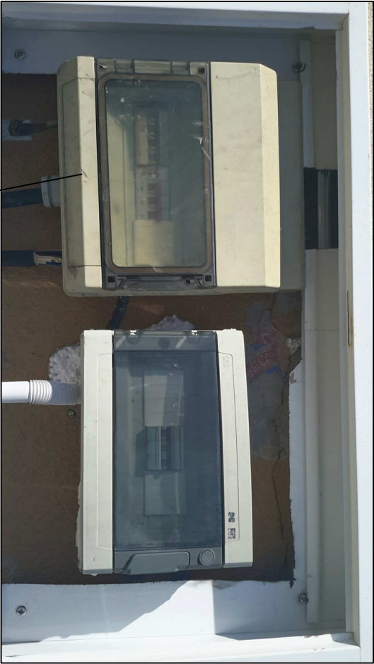
(*)1 ISTNIEJĄCA TABLICA NA BUDYNKU: